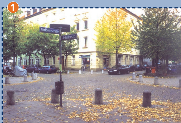
1 Guldein-/Astallerstraße: Übergänge sind sehr oft von ausladenden Lastwagen zugeparkt