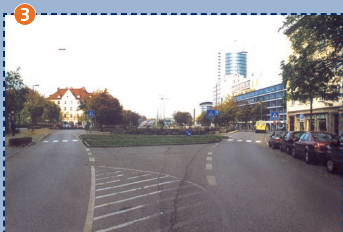
3 Zebrastrifen Trappentreustraße