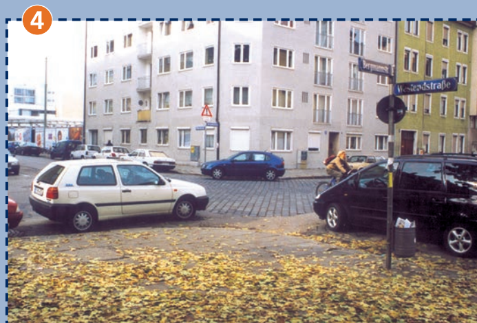
4 Kreuzung Bergmann-/Westendstraße