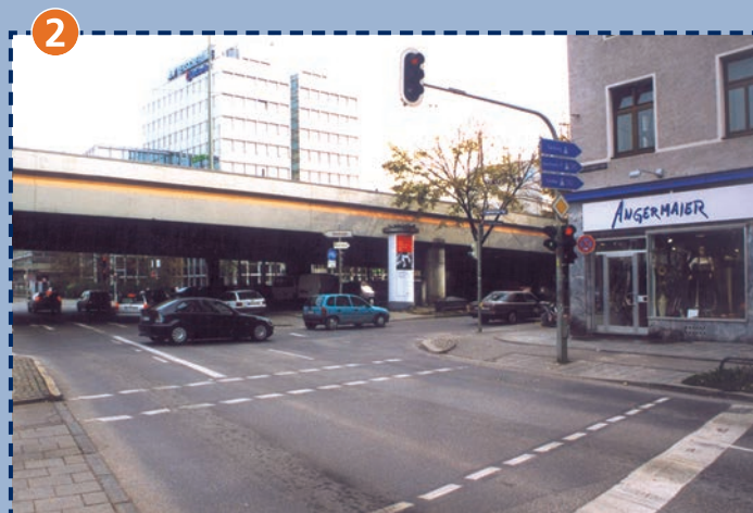
2 Trappentreustraße/Landsberger Straße: Trotz Ampeln sehr kritisch! Vorsicht!